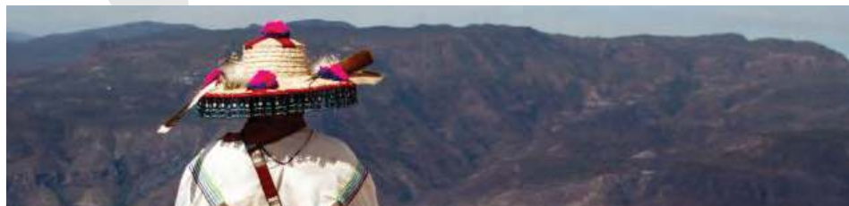
POBLACIÓN HABLANTE DE LENGUA INDÍGENA SEGÚN LENGUA (Porcentaje)

Son aquellas etnias que no cuentan con ningún cristiano, ningún misionero, no hablan un idioma nacional, entonces la mayoría no cuentan con ninguna escritura traducida. No tienen acceso a luz eléctrica, servicio telefónico, comunicaciones modernas, y en muchos casos no hay acceso a ellas por carreteras.