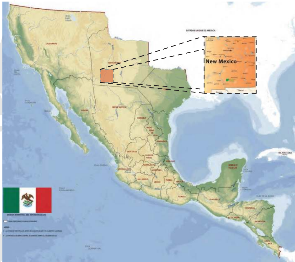
Mapa México antiguo 1850 (la ubicación aproximada)

En el último censo realizado por el INEGI, en el 2020 se registró un aumento significativo en el número de profesantes cristianos (reconociendo obviamente que no todos aquellos que se consideran protestantes o evangélicos tienen el Evangelio de Cristo) en ocho entidades se observa un incremento de 15% o más de iglesias protestantes (Baja California, Campeche, Chiapas, Oaxaca, Quintana Roo, Tabasco, Tamaulipas y Yucatán), destacando Chiapas (32.5%), Tabasco (27.1%), Campeche (24.3%) y Quintana Roo (20.9%),