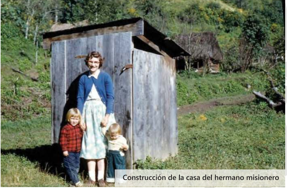
Construcción de la casa del hermano misionero