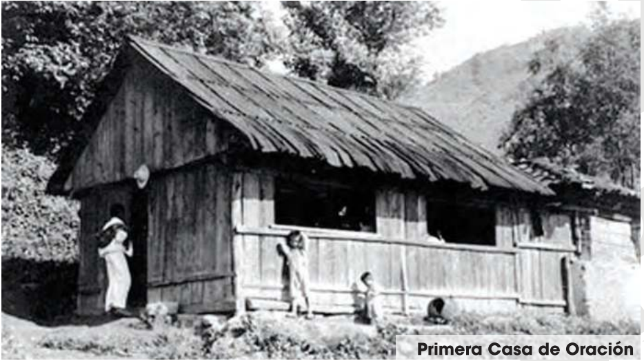
Primera Casa de Oración